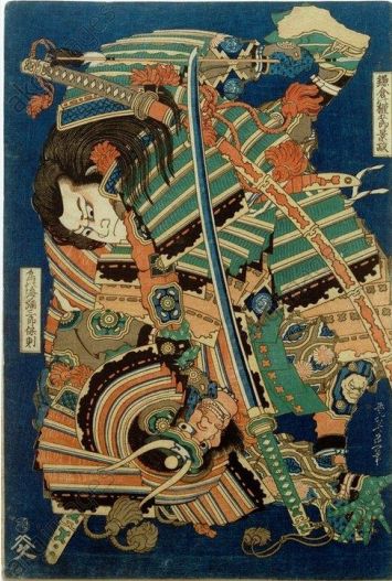
Kamakura Gongoro Kagemasa et Torinoumi Yasaburo Yasunori en duel