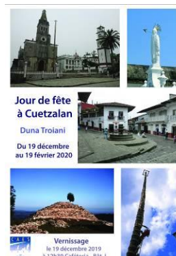
Affiche par Duna Troiani

Accrochage le 18 décembre et vernissage le 19 décembre.