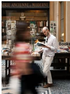
Dans un monde de mots

- Photos sur le vif , le samedi 23 juin, dans le quartier de Saint Germain des Près, dans le 6 e arrondissement.