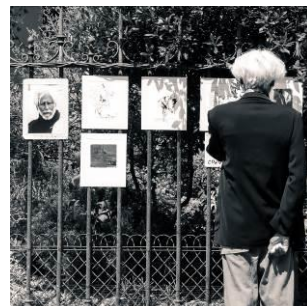
La vie est une poésie