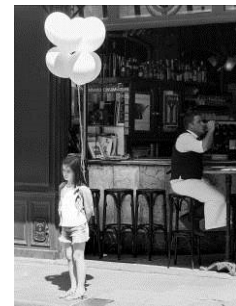
J'attends ma maman

Un grand merci à Darryl pour ces stages très instructifs et utiles et conviviaux