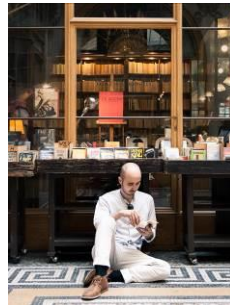
Prendre le temps de s'évader