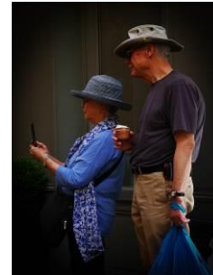
Touristes à Paris